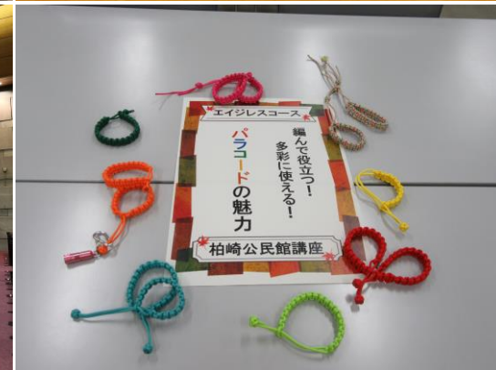
パラコード講習（市民講座）