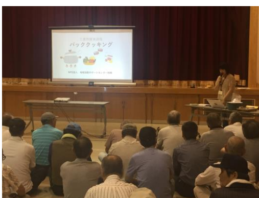
コミセン防災ワーク

コミセン、町内会、PTA、保育園、小・中学校、企業、老人会、 高齢者運動サポーター、ファミリーサポートセンター、各種サークル