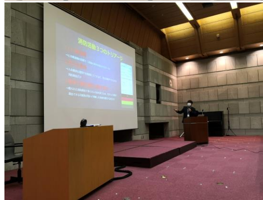
講演会（福島県立博物館）