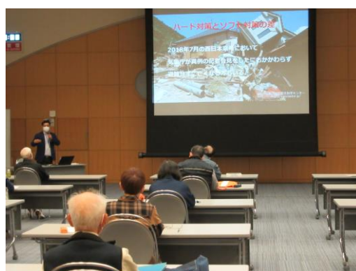
かしわざき市民大学